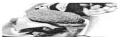
KFC Dié kolonel kan